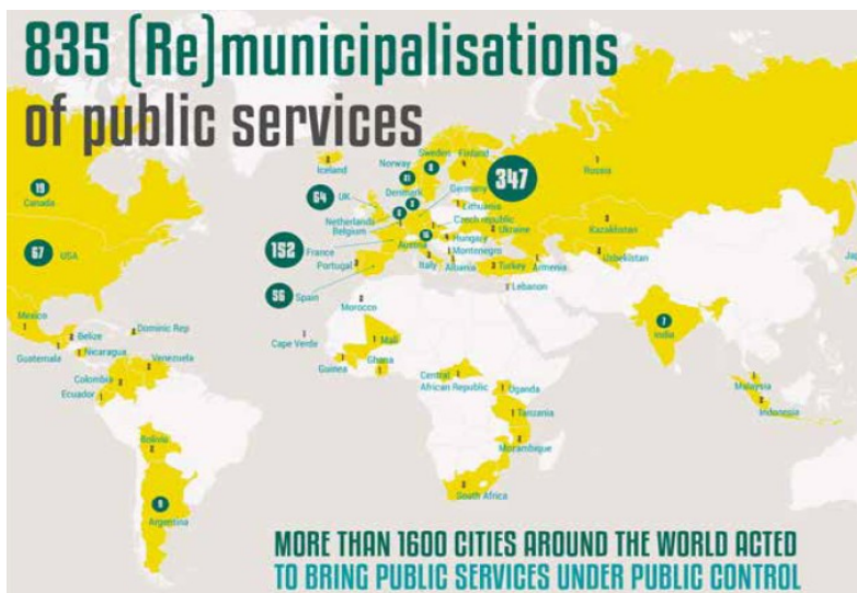
Χάρτης επαναδημότευσης υπηρεσιών στον κόσμο: περισσότερες από 1600 πόλεις σε 45 χώρες ανέλαβαν δράση για να επιστρέψουν τις βασικές υπηρεσίες και αγαθά σε δημόσιο έλεγχο.

* Στην έκδοση συμμετείχαν οι Ομοσπονδίες και Οργανώσεις: Transnational Institute (TNI), Multinationals Observatory, Austrian Federal Chamber of Labour (AK), European Federation of Public Service Unions (EPSU), Ingeniería Sin Fronteras Cataluña (ISF), Public Services International (PSI),