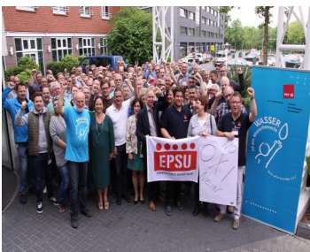
Η συνάντηση της Ver.di έγινε 17-18 Μαΐου στο Ντόρτμουντ.

(19 Μαΐου 2017) Συνδικαλιστές/τριες και μέλη των εργατικών συμβουλίων του Γερμανικού Τομέα Ύδρευσης έστειλαν ένα ηχηρό μήνυμα αλληλεγγύης στους Έλληνες/ίδες συναδέλφους τους. Τα ελληνικά συνδικάτα και οργανώσεις στον τομέα των υδάτων των επιχειρήσεων ύδρευσης σε Αθήνα και Θεσσαλονίκη αντιστέκονται στην ιδιωτικοποίηση των επιχειρήσεών τους. Πρόκειται για ιδιωτικοποιήσεις που επιβάλλουν οι Ευρωπαϊκοί θεσμοί και το ΔΝΤ τη στιγμή που οι επιχειρήσεις είναι οικονομικά εύρωστες. Ο μόνος λόγος που