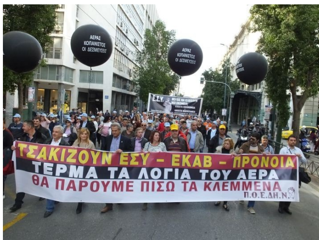
Στιγμιότυπο από το μπλοκ της ΠΟΕΔΗΝ στην 24ΩΡΗ Απεργία στις 2 -12-2015

Ταυτόχρονα να υπάρξει περαιτέρω ελαστικοποίηση των εργασιακών σχέσεων (μπλοκάκια, συνεργεία, εκπαιδευόμενοι, ορισμένου χρόνου, ΕΣΠΑ κλπ)».