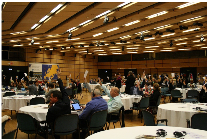
Γενική άποψη της αίθουσας του συνεδρίου στη Βιέννη, 26-27 Νοεμβρίου

Η ΕΕ προωθεί αξίες της αγοράς, της επιχειρηματικότητας και του ανταγωνισμού στο χώρο της εκπαίδευσης σε βάρος οικογενει-