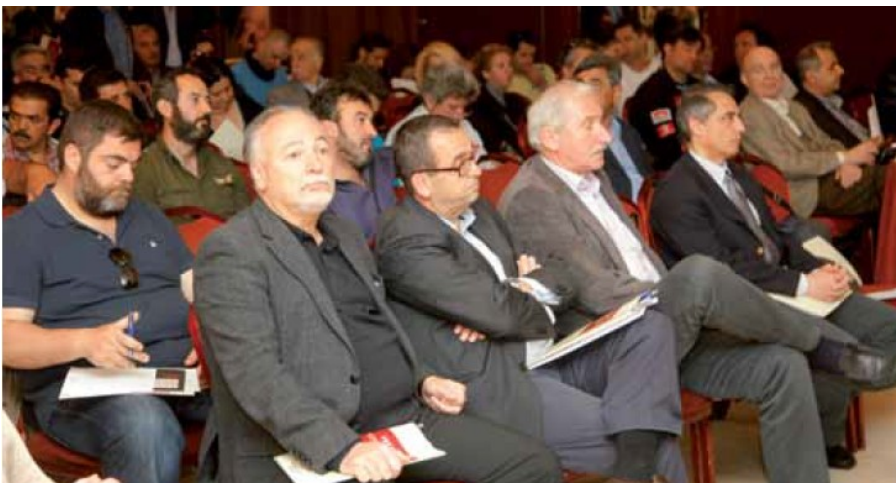
Στιγμιότυπο κατά την έναρξη των εργασιών της ημερίδας