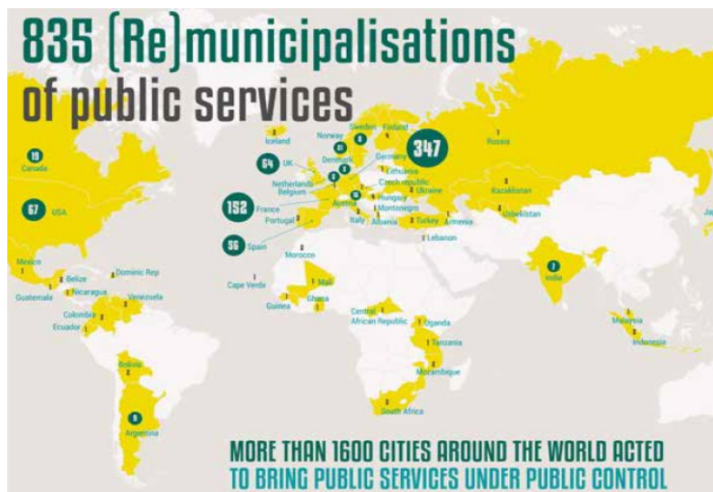
Χάρτης επαναδημότευσης υπηρεσιών στον κόσμο: περισσότερες από 1600 πόλεις σε 45 χώρες ανέλαβαν δράση για να επιστρέψουν τις βασικές υπηρεσίες και αγαθά σε δημόσιο έλεγχο.

* Στην έκδοση συμμετείχαν οι Ομοσπονδίες και Οργανώσεις: Transnational Institute (TNI), Multinationals Observatory, Austrian Federal Chamber of Labour (AK), European Federation of Public Service Unions (EPSU), Ingeniería Sin Fronteras Cataluña (ISF), Public Services International (PSI),