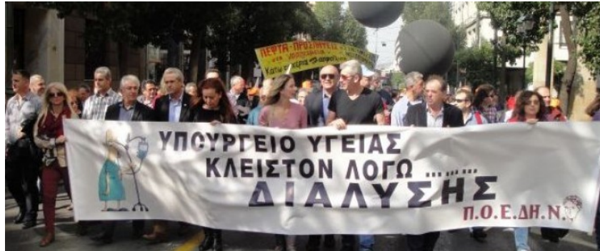
Στιγμιότυπα από την κινητοποίηση της ΠΟΕΔΗΝ 18/2

χρηματοδότηση προς το Σύστημα και τα λειτουργικά έξοδα διαβιβάζονται στους πολίτες με άμεσα ή έμμεσα χαράτσια (αγορά υπηρεσιών, επιβολή δημοτικών τελών κ.α). Επιδιώκουν να καταστήσουν το Σύστημα ΑΥΤΟΧΡΗΜΑΤΟΔΟΤΟΥΜΕΝΟ με την εμπλοκή των φορέων της Τοπικής Αυτοδιοίκησης, καθώς επίσης την εμπλοκή μη