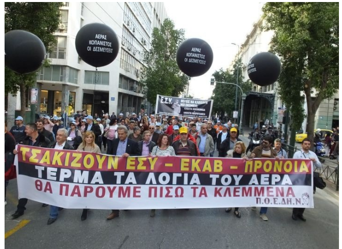
Στιγμιότυπο από το μπλοκ της ΠΟΕΔΗΝ στην 24ΩΡΗ Απεργία στις 2 -12-2015

Ταυτόχρονα να υπάρξει περαιτέρω ελαστικοποίηση των εργασιακών σχέσεων (μπλοκάκια, συνεργεία, εκπαιδευόμενοι, ορισμένου χρόνου, ΕΣΠΑ κλπ)».